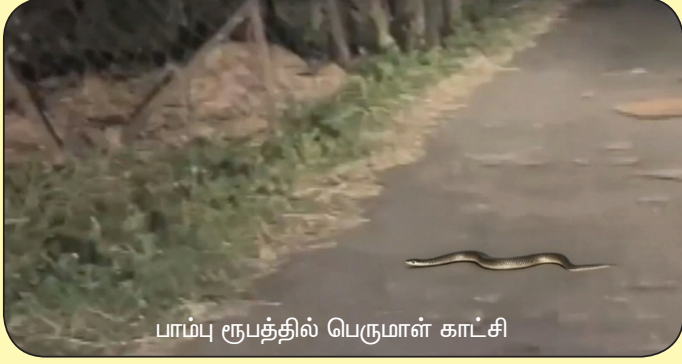
பாம்பு ரூபத்தில் பெருமாள் காட்சி