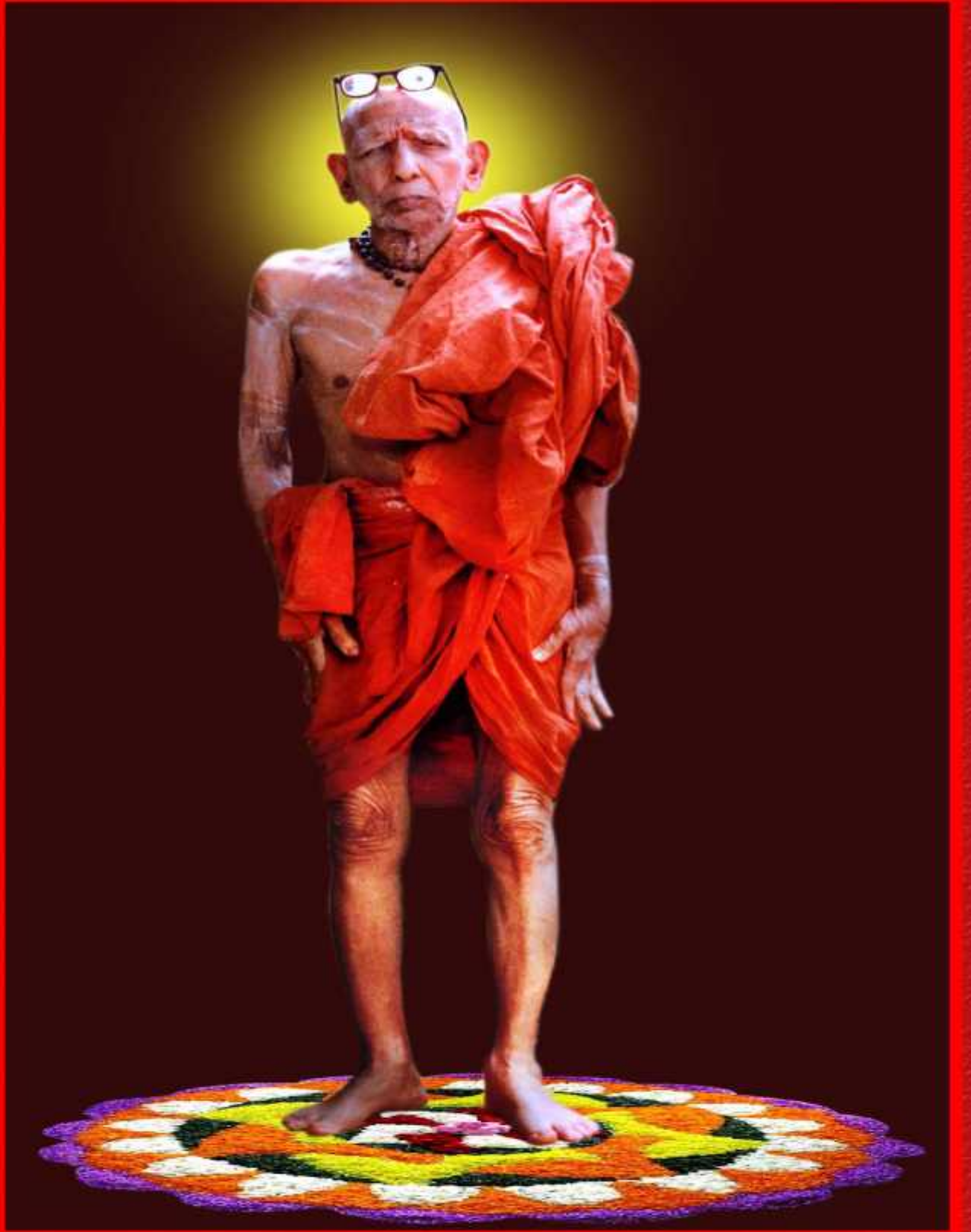
அத்வைத குருவின் அதிகாலை விஸ்வரூப தரிசனம்